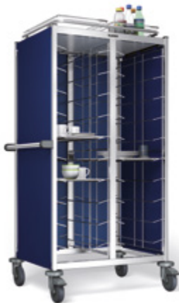
TAW 2 x 10 GN avec toit du chariot en acier inoxydable, galerie périphérique et poignée de poussée (illustr. avec accessoires)