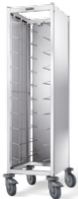
TAW 10 GN avec habillage sur 3 côtés, acier inoxydable