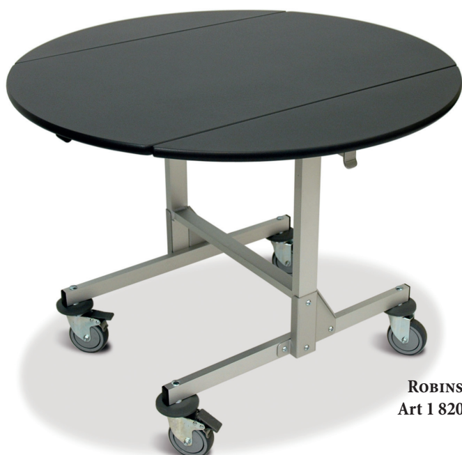
ROBINSON Art 1 820 001