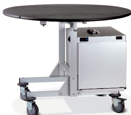
FUEGO Art 1 720 101