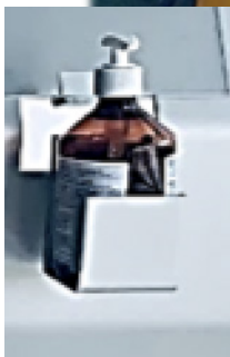
Support gel en option Optionaler Halter