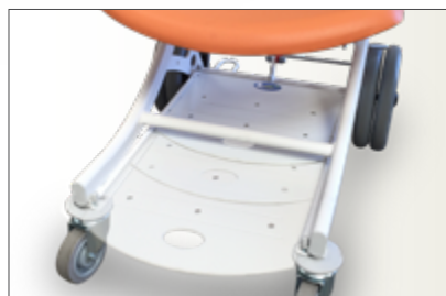
Détail repose-pieds coulissant

Charge de Fonctionnement en sécurité : 250 kg.