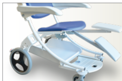
Repose jambes deux positions (en option)