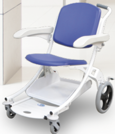
Chaise de transfert I-MOVE permettant l'accueil des patients