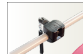
Réf TROMO Monnayeur