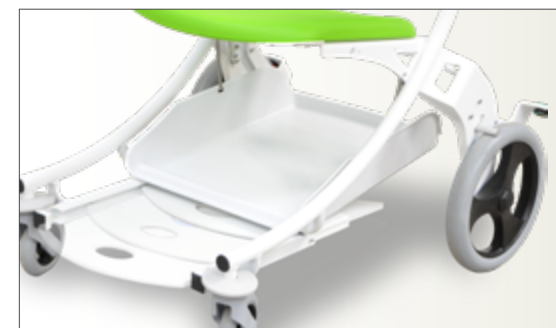
Détail repose-pieds coulissant

Charge de Fonctionnement en sécurité : 200 kg.