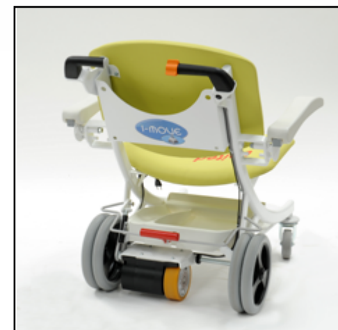
Roue motorisée avec batterie et chargeur intégrés.

Charge de Fonctionnement en sécurité : 200 kg.