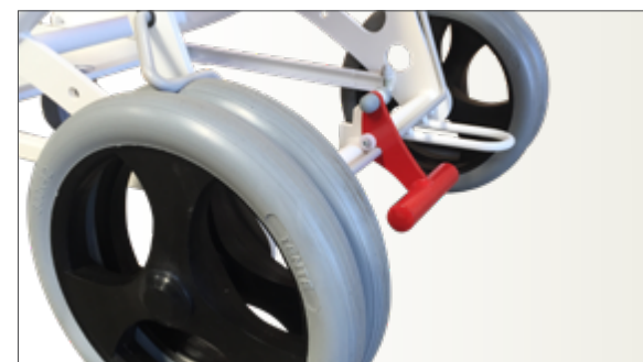
Détail roues arrières jumelées Ø 300 avec frein centralisé