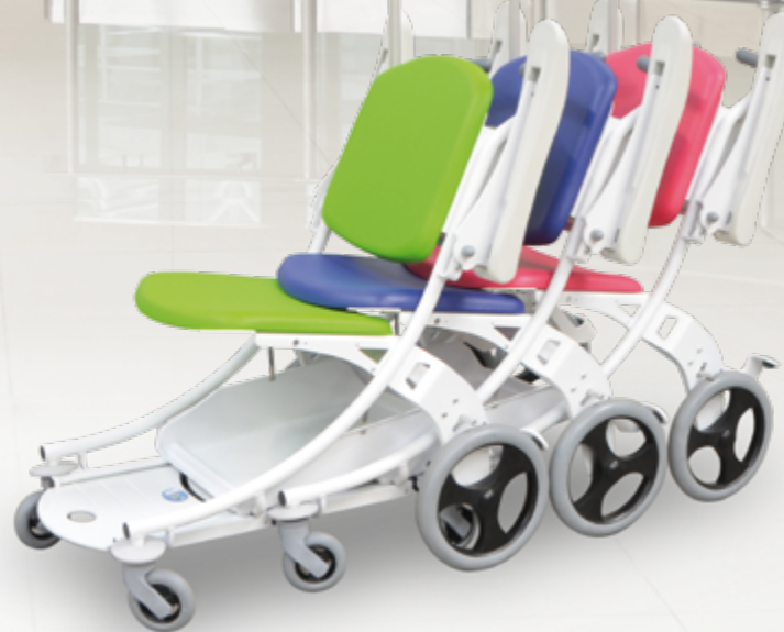
Chaises de transfert I-Move encastrées permettant un rangement optimisé