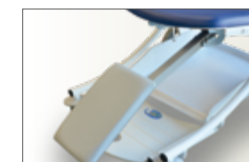
Réf TRORJ Repose jambes réglable