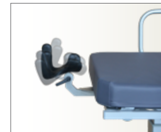
Tête Stomatologique multi-positions et amovible (en option)