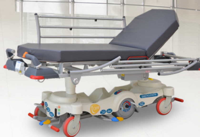
I-CARE EZ-GO Ambulatory 60 / Ambulatory 70 / Ambulatory 80 Chariot brancard motorisé à hauteur variable hydraulique