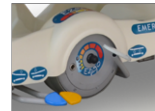
Détail roue motorisée autonome.