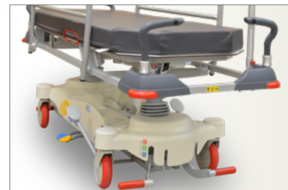
Détail barres de poussée escamotables