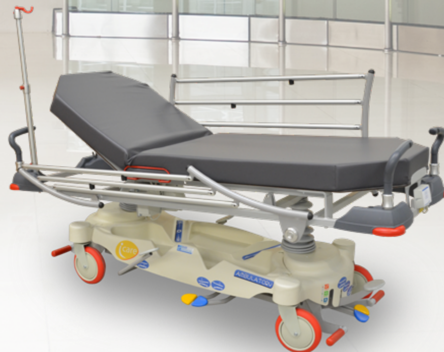
I-CARE Ambulatory 60 / Ambulatory 70 / Ambulatory 80 Chariot brancard à hauteur variable hydraulique