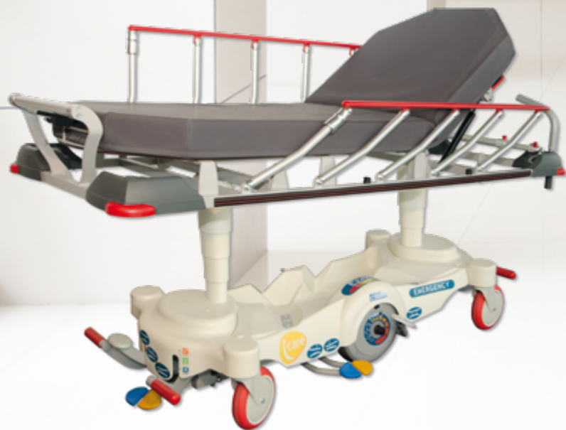
I-CARE EZ-GO Emergency 60 / Emergency 70 Chariot brancard motorisé à hauteur variable hydraulique