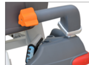
Détail poignée rotative avec accélération progressive.