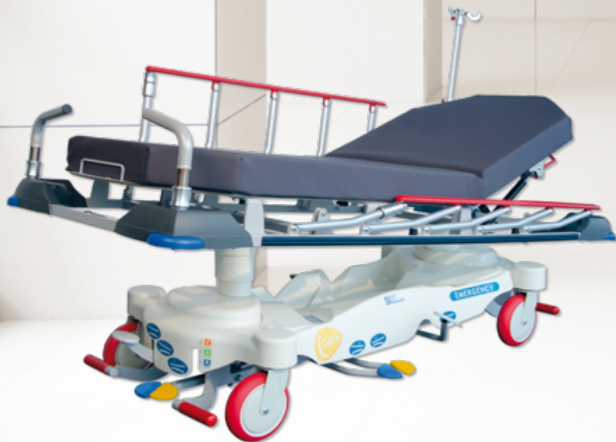
I-CARE Emergency 60 / Emergency 70 Chariot brancard à hauteur variable hydraulique