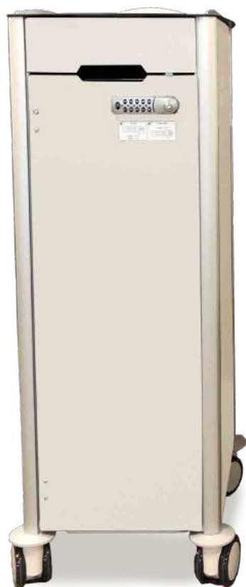
VEST : H=126 CM GRAND MODELE GROSSES MODELL