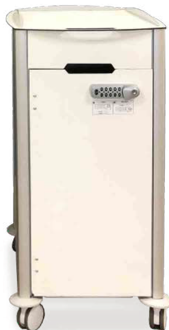
VEST_P : H=92 CM PETIT MODELE KLEINES MODELL