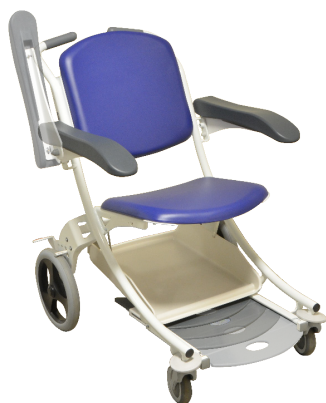
Bleu / Blau