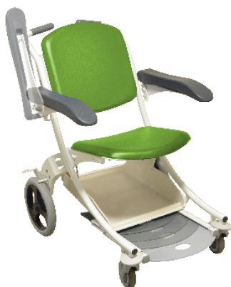
Vert anis / Anis