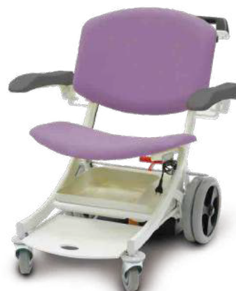
Lavande / Lavandel