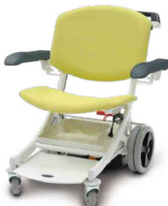
Vert / Grün