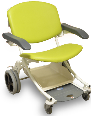
Vert / Grün