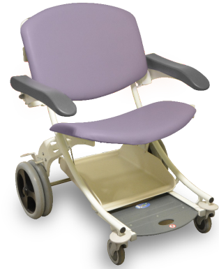
Lavande / Lavandel