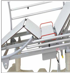
CRORJ & CORJE