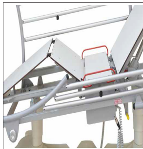
CRORJ & CORJE