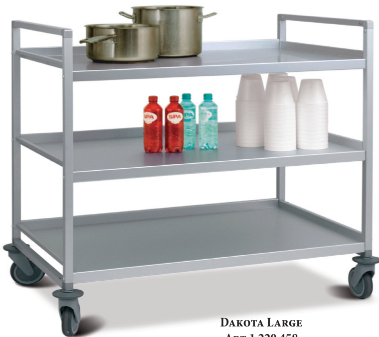
DAKOTA LARGE ART 1 220 458