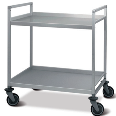
DAKOTA SMALL ART 1 220 408

Rebords de 40 mm sur 3 cotés Kanten mit 40 mm Höhe auf 3 Seiten