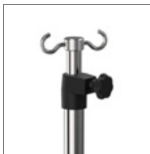
TSE2C - TSE4C TSR2 - TSR4