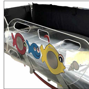
CKOCL & CKOCT