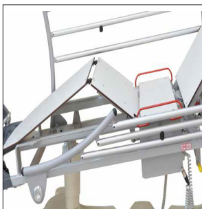
CRORJ & CORJE