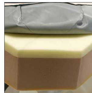
MC & MMC